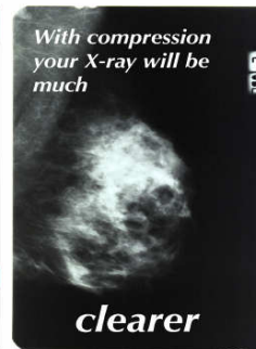
Met samendrukken zal uw röntgenopname scherper zijn