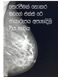
තෙරපීමක නොකර ඔබගේ එක්ස් රේ ජායාරූපය ඇපැහැදිලි විය හැකිය

තෙරපීම හේතුවෙන් තද හෝ අපහසු බවක් දැනුනද මෙය තත්පර කිහිපයකට පමණි. ඔහුම අවස්ථාවක විකිරණ ශුන්‍යයෙන් නවත්වන ලෙස ඉල්ලා සිටිය හැකිය.